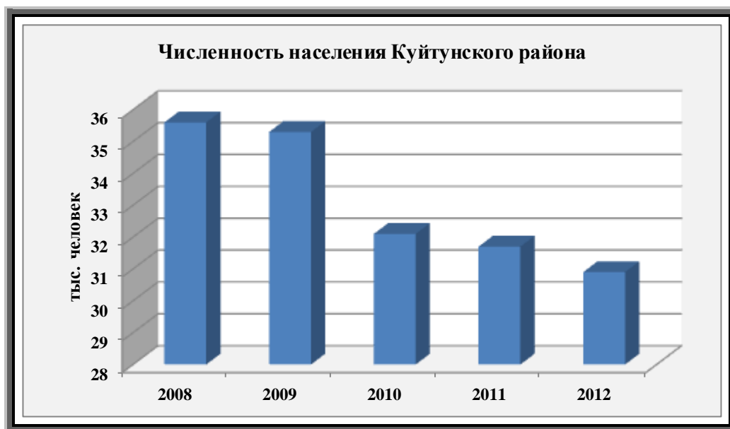
Рис. 1. Численность населения Куйтунского района

В Куйтунском районе наблюдается сокращение численности населения: