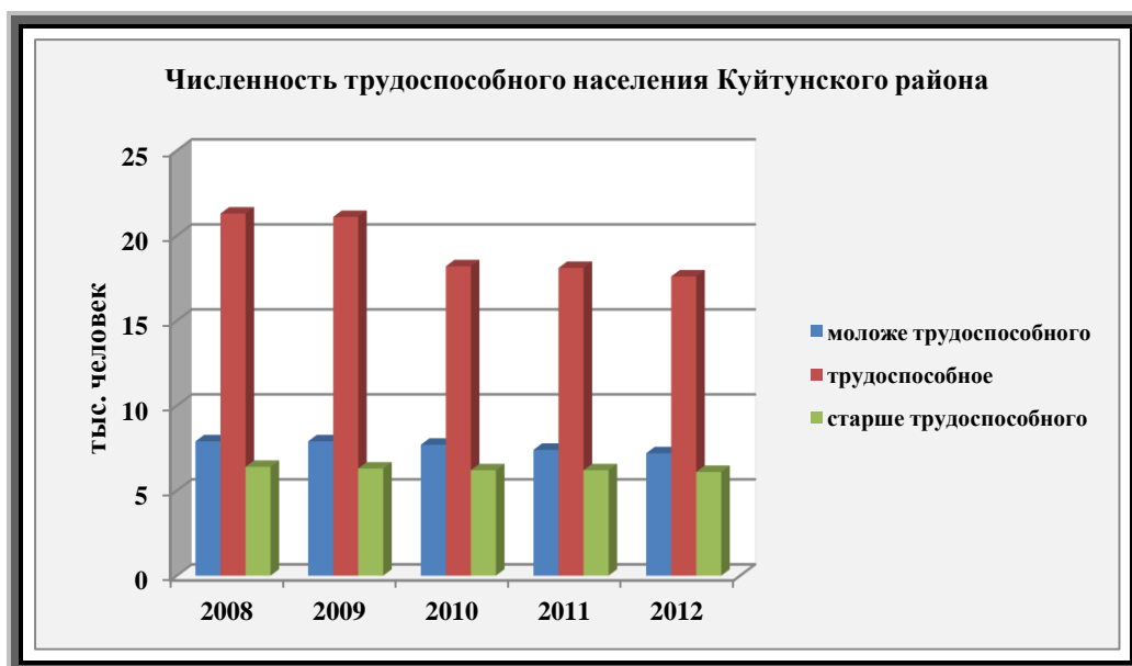
Рис. 2. Численность трудоспособного населения Куйтунского района

Наблюдается уменьшение трудоспособного населения, причем наиболее квалифицированной его части, рост заболеваемости населения и другие негативные демографические явления.